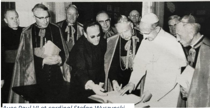
Avec Paul VI et cardinal Stefan Wyszyński

Ont ainsi été publiés entre autres : des Lettres du cardinal Wyszyński, des documents du Concile Vatican II, le Missel Romain d'Autel (grand format) (1968), le Catéchisme de la Religion Catholique en quatre volumes (1977), la Bible Illustrée (1982-1984), la collection « Znaki Czasu » (Signes du Temps), 56 titres au total (1967-1993).