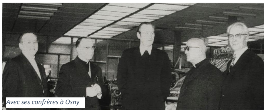
Avec ses confrères à Osny

Accompagné d'une quinzaine d'ouvriers italiens, en 1953 il arrive en France, et supervise la construction des différents bâtiments du Collège Saint Stanislas, et à partir de 1956, ceux de l'Imprimerie de Busagny et du Lycée professionnel. En 1962, le primat de la Pologne, le cardinal Stefan Wyszyński, donne sa bénédiction à l'Imprimerie d'Osny pour les travaux d'édition religieuse.