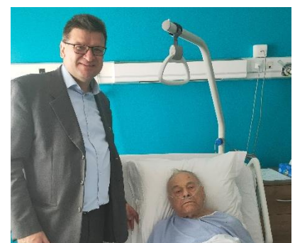
A la clinique du Val d'Or à Saint Cloud : quelques jours avant son décès.