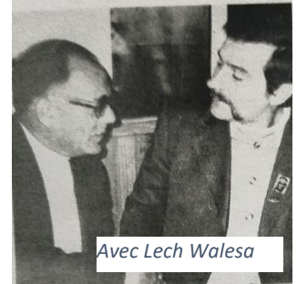
Avec Lech Wałęsa