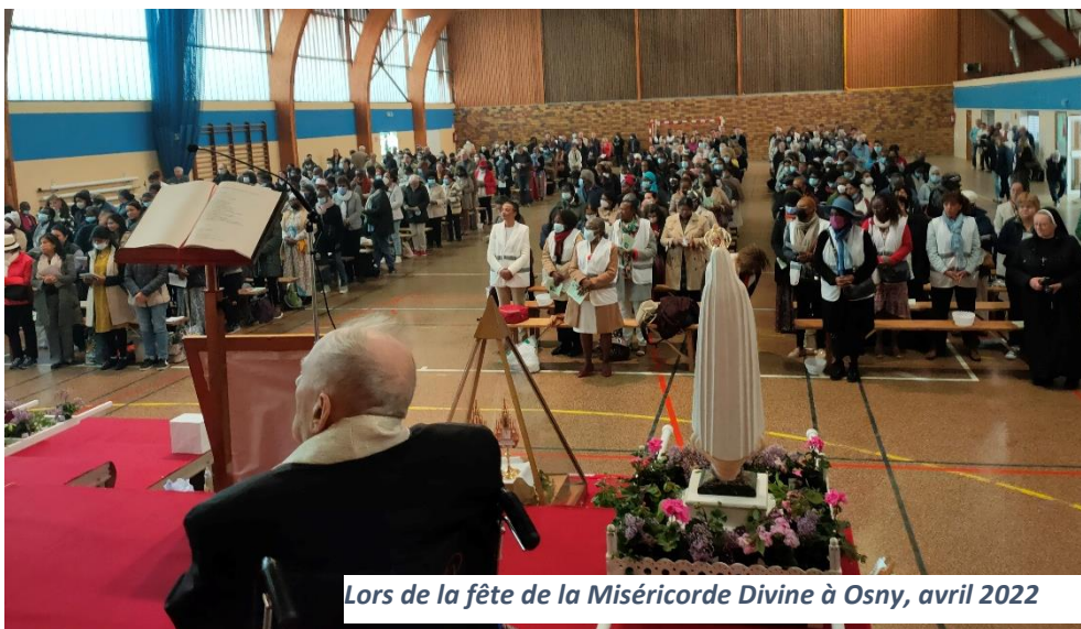
Lors de la fête de la Miséricorde Divine à Osny, avril 2022

« Je suis la résurrection et la vie. Celui qui croit en moi vivra » (Jn 11.25)