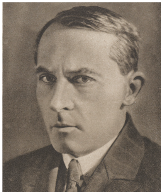
Stanisław Witkiewicz

La conférence sera suivie d'un verre de l'amitié